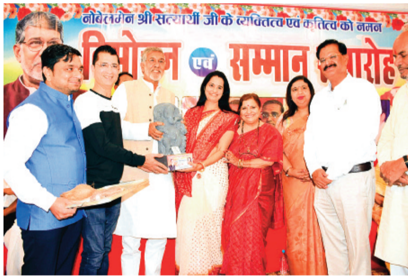
श्री सत्यार्थी ने कहा कि विदिशा चैप्टर के डॉक्टर जो कार्य कर रहे हैं वह काफी सराहनीय है। दुनिया में

विदिशा चैप्टर ग्रुप द्वारा रविवार को सम्मान समारोह आयोजित किया गया। जिसमें मुख्य अतिथि के रूप में नोबल पुरस्कार विजेता कैलाश सत्यार्थी शामिल हुए। सम्मान समारोह में कैलाश सत्यार्थी ने महिला चिकित्सा सेवा से जुड़े डॉक्टरों का सम्मान किया। इस दौरान नागरिकों ने कैलाश सत्यार्थी का नागरिक अभिनंदन किया। वहीं इस मौके पर कैलाश सत्यार्थी व्यक्तित्व एवं कृतित्व को नमन विशेषांक का विमोचन किया गया। जिसमें कैलाश सत्यार्थी के जीवन के बारे में विस्तार से जानकारी दी गई है। इस मौके पर कैलाश सत्यार्थी ने कहा कि उन्हें अपनी जन्मभूमि पर आने में काफी गौरव महसूस होता है। अपनों के बीच, भाई, बहन, बेटा भतीजे आदि के बीच आकर काफी खुश मिलती है। वह हमेशा और हर बार नई ऊर्जा के साथ यहां से जाते हैं। उन्होंने कहा बेतवा का पानी समाज सेवा से जुड़ा हुआ है, समाज के हर वर्ग की चिंता करने वाला है।