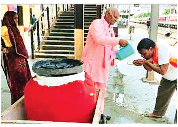
हरिभूमि न्यूज अशोकनगर

अशोकनगर बीना कोटा रेल लाइन का महत्वपूर्ण स्टेशन है यहां रेलवे द्वारा कोई पानी की व्यवस्था नहीं की जाती है रेलवे जनता से यात्रा के पैसे लेती है रिजर्वेशन कराने पर पैसा लेती है लेकिन जो उसकी मौलिक सुविधाओं के अधिकार है उसके अंतर्गत पानी उपलब्ध नहीं करती न आपकों ठंडा पानी मिलेगा न गर्म पानी मिलेगा। प्याऊ है तो नल बंद है और नल है तो पानी नहीं है। यह स्थिति अशोकनगर स्टेशन की है ऐसे में जनता करे तो क्या करें। रेलवे से लड़ाई लड़ने वाला कोई शहर में नहीं है कि वह समस्या के निराकरण के लिए रेलवे के अधिकारियों और यहां के नेताओं को जगा सके। आखिर मजबूरी में शहर की जनता और उनसे जुड़े जनप्रतिनिधि गर्मी के इस मौसम में लोगों को पानी उपलब्ध कराने के लिए प्याऊ का