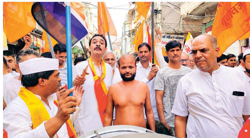
हरिभूमि न्यूज अशोकनगर

दिगंबर जैन दर्शन के 24 वे तीर्थंकर भगवान महावीर स्वामी का जन्म कल्याणक दिवस रविवार को विविध धार्मिक कार्यक्रमों के साथ उत्साह पूर्वक मनाया गया। इस मौके पर शहर में निकली शोभायात्रा आकर्षण का केन्द्र रही भगवान महावीर को चांदी की पालकी में शहर का बिहार कराया गया। पूरा शहर उत्सव में डूबा नजर आया। महिला संगठनों की उपस्थिति के साथ घर घर द्वार बनाई गई रंगोलिया भी आकर्षण का केन्द्र रही।